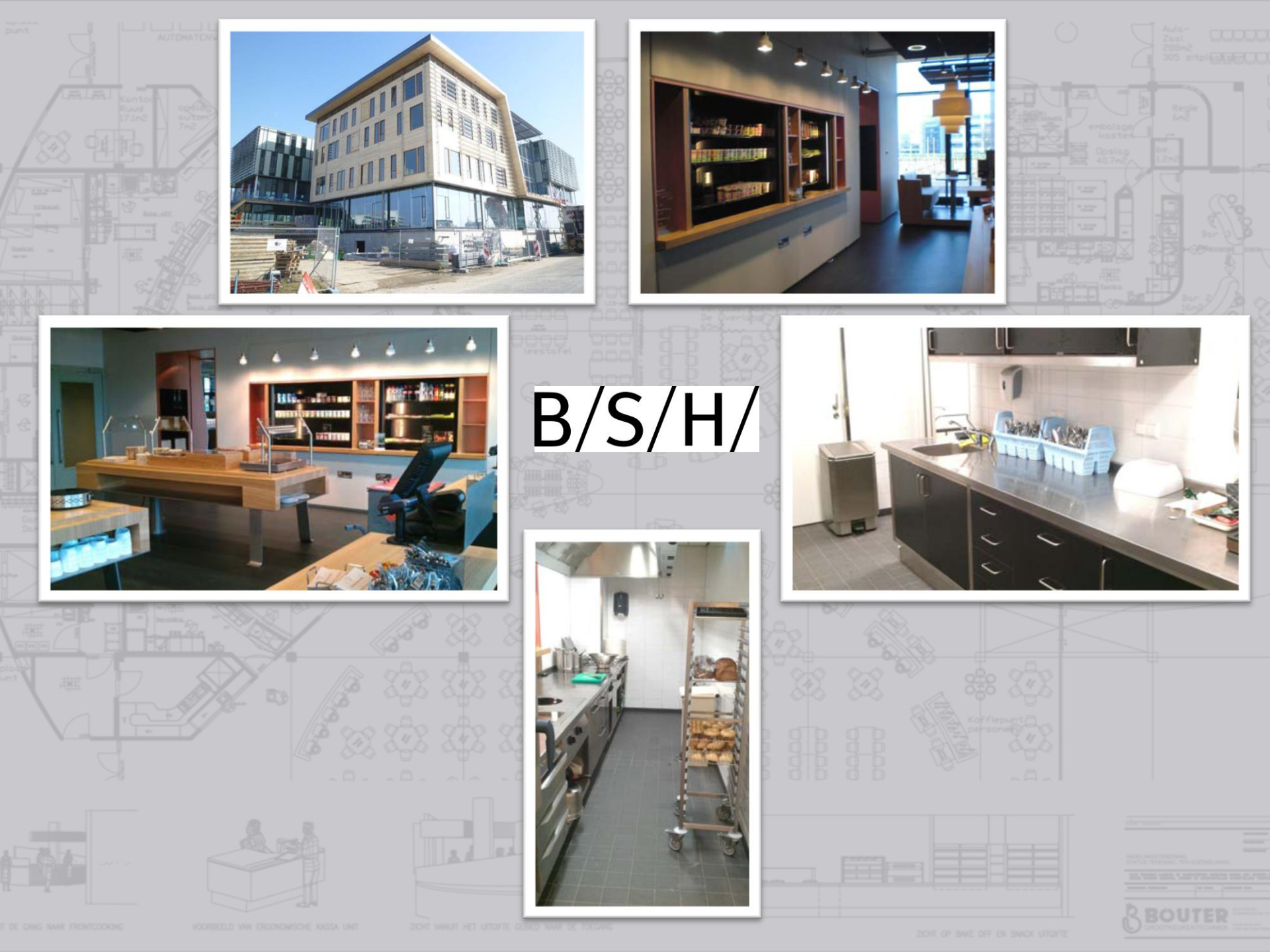
ZIET DE GANG NAAR FRONTCOOKING